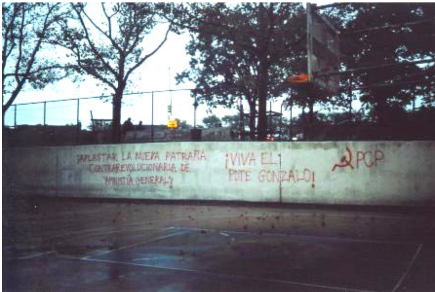
Queens, New York, Estados Unidos, octubre 2006:

grupo de jóvenes, toda la población, jóvenes y viejos, se enfrentó durante toda una tarde y toda una noche con las fuerzas policiales, por las calles del barrio volaban las piedras y las botellas contra la policía anti-motines,