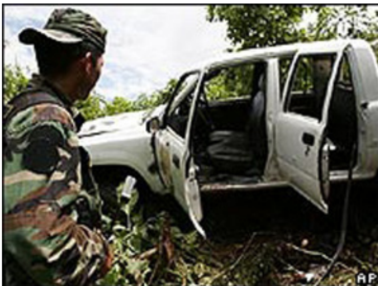
Después de una emboscada del PCP, 20 de diciembre de 2006

oposición “fundamental” hasta más allá de la mitad del período presidencial de García. Con todo han tenido que “consensuar” para aprobar las medidas que García las ha sometido al parlamento, en otras ha chocado como en el caso de la “pena de muerte” o en su búsqueda de apoyo del parlamento para enfrentar a la CIDH. Aquí, se desenvolverán por eso en colusión y pugna hasta que García decida patear el tablero, disolviendo el parlamento y convocando a nuevas elecciones. Por eso la llamada “ reforma constitucional de la Constitución del 93 ” o la “ vuelta a la Constitución del 79 reformada en su capítulo económico ” o una totalmente “nueva” no puede ser abordada de inmediato ni por el aprendiz de Guadameco ni menos por los otros partiduchos. La derrota de APRA en las elecciones regionales y municipales le ha traído no sólo atrasos en su plan de “shock” sino también en el de concentrar poder en sus manos y retrasa sus planes para solucionar la cuestión