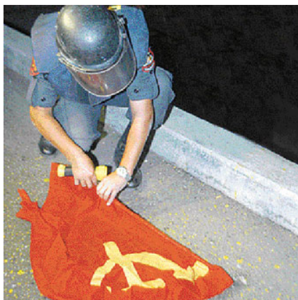
La policía bajando una bandera del Partido, 2006