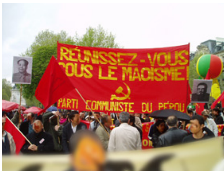
París, Francia, 1º de mayo de 2006: “¡Unirse bajo el maoísmo! Partido Comunista del Perú”.

mente, bajo el superimperialismo del “Estado globalizado del imperialismo yanqui”. Eso es, por más que lo traten de cubrir bajo el manto de supuesta sobriedad, puro idealismo, pesimismo de quienes no ven nada más que el hueco negro de su tumba. Por el contrario, un simple vistazo al mundo confirma que las condiciones para la revolución mundial son excelentes, y, cuando pasamos a ver detalladamente la situación política mun-