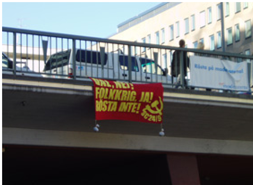
Bandera en Estocolmo contra las elecciones en Suecia en 2006: “¡Elecciones, no! Guerra popular, sí! ¡No votar!”

la cual para mi es difícil ver como esto pueda llevar a un dialogo”. El diario francés Le Figaro publicó, el 11 de noviembre de 2005, un artículo donde sostiene que “ Rinkeby [un barrio proletario de Estocolmo], es un modelo sueco a seguir en los barrios ”; los enviados de dicho diario en forma lírica escriben sobre el “éxito sueco” en