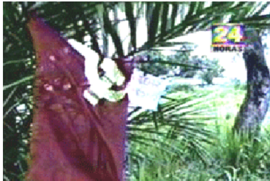
Bandera del PCP en Tingo María, 2006

Ese es el sentido del reconocimiento público del genocida Bush, quien como “buen amo” ha dicho del aprendiz de guadameco, del genocida García, lo siguiente: “Y hablamos (con García, nota nuestra) sobre la necesidad de trabajar juntos para ayudar a promover la justicia social. El Presidente (se refiere a García, nota nuestra) tiene un gran corazón. Le importan muchísimo aquéllos que sufren. Y le aseguré al Presidente que sirve a los intereses de nuestro país que trabajemos con nuestros amigos en Sudamérica para promover la buena educación y la buena atención médica y las buenas oportunidades” (Oficina del Secretario de Prensa de la Casa Blanca, 10 de octubre de 2006) (Declaraciones del Presidente Bush y el Presidente Alan García de Perú en the Oval Office).