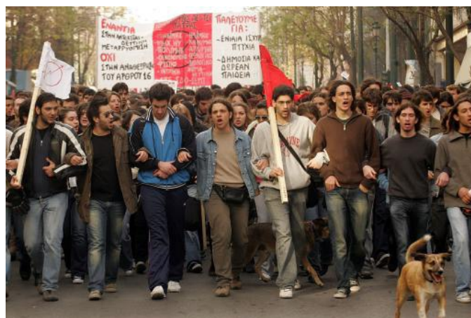
Luchas en Grecia, 2008