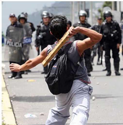
Protesta popular en Ecuador

Entonces los antecedentes y fundamentos de esta iniciativa reside en la intensificación de la intervención militar del imperialismo yanqui en Colombia, el 2003 (por tanto en esta parte de América Latina que corresponde a los países andinos, en Sudamérica), “con el inicio del “Plan Patriota”, que fue “la ofensiva más grande contra los grupos armados, marcó una etapa de mayor intensidad en la cooperación militar entre Colombia y Estados Unidos...el Comando Sur participó activamente en su diseño y fue protagónico en su ejecución” (Foreign Affairs, Latinoamérica; Vol 8, N°4, 2008). El mismo que el año 2004 amplió el número de tropas y contratistas yanquis (troop cap) y así ha continuado en los años siguientes hasta el presente. En Colombia, el Comando Sur entrena a oficiales y suboficiales de las genocidas Fuerzas Armadas del viejo estado peruano (FF. AA.), como a otros de sus similares de América Latina, ahí funcionan campos que cumplen algunas de las funciones que cumplía la Escuela de las Americas (centro de entrenamiento y adoctrinamiento yanqui para la guerra contrarrevolucionaria y de conquista donde se prepara a sus lacayos del continente