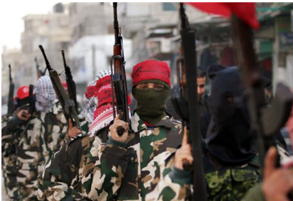
Combatientes de PFLP en Palestina

yanquis) y docenas de miles de mercenarios (Blackwater) y tropas de otros países, para controlar una población total de 28 millones, no pueden aplastar la lucha armada de resistencia nacional. Además, digan lo que digan los propagandistas yanquis, los hechos hablan por si mismo, como demuestra el ejemplo que sigue.