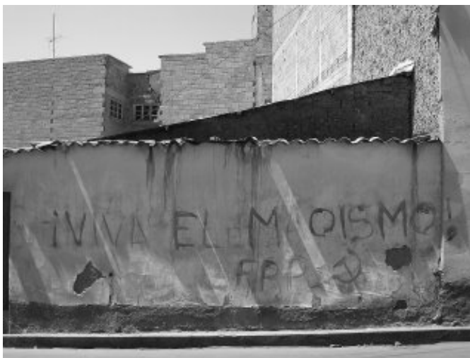
“¡Viva el maoísmo!” - pinta en Bolivia

como Haití aparece como el lugar en donde estas tropas se están preparando para lo que en el futuro pueda darse en Latinoamérica. El Coronel Oliva Neto ha argumentado, dice Zibechi, sobre la necesidad de colaboración militar sudamericana para la formación de un “Sistema