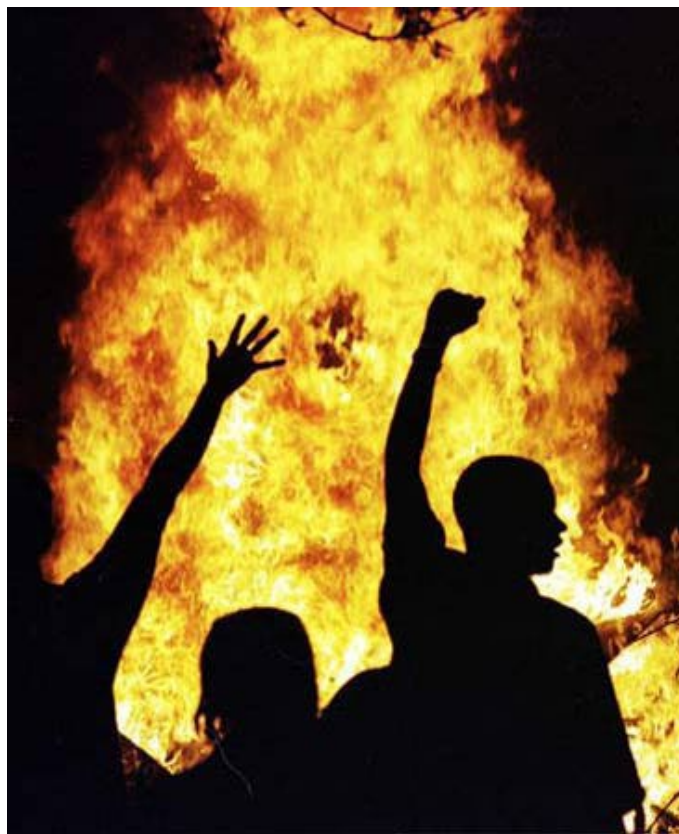
Los Angeles 1992

"...no es el momento y las condiciones aún no existen para ponerlo todo en juego para tomar el poder, pero "ahora SÍ ES el momento de estar TRABAJANDO PARA LA REVOLUCIÓN —de estar aumentando la resistencia mientras que se está forjando un movimiento para la revolución— a fin de prepararse para el momento en que SÍ SERÁ posible jugárselo todo para tomar el poder"... pero "acelerar mientras aguardamos" el desarrollo de una situación revolucionaria y el surgimiento de un pueblo revolucionario de millones y millones... Pero sí quiero recalcar la importancia de este entendimiento: por un lado, sin resistencia, sin luchar contra el poder, no será posible construir un movimiento revolucionario; por otro lado, si los comunistas no ven esa resistencia con la orientación de construir un movimiento para la revolución y la meta de abolir este sistema capitalista y crear una sociedad y un mundo radicalmente nuevo, esa resistencia quedará ...Aunque otras personas con las que nos unimos en luchas particulares tendrán diferentes puntos de vista, tenemos que proceder en todo lo que hacemos con el entendimiento y desde el punto de vista que está concentrado en el enunciado: " Luchar contra el poder, y transformar al pueblo, para la revolución ". (Bob Avakian, La resistencia y la construcción de un movimiento para la revolución, Contradicciones todavía por resolver, Fuerzas que impulsan la revolución )