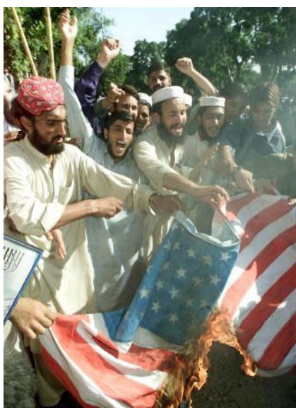
Pakistan: ¡Yanqui go home!

Es claro que, tanto los imperialistas como “sus críticos”, quieren velar el contenido de clase de la lucha actual y pretenden lograr que, las masas de los países imperialistas, condenen la resistencia de las diversas clases y fuerzas de los países agredidos, que conforman en conjunto el movimiento de liberación nacional de estos países, como expresión de “retrógrados feudales” contra su contraparte los “retrógrados imperialistas”. De esta manera se busca confundir a las masas de los países imperialistas para que no se genere un poderoso movimiento de rechazo contra la guerra imperialista y de apoyo a las luchas de liberación nacional, como en la “época de Vietnam”, por lo tanto sirve a crear opinión pública favorable a la guerra imperialista y no sirve al desarrollo de la situación revolucionaria en los propios países imperialistas.