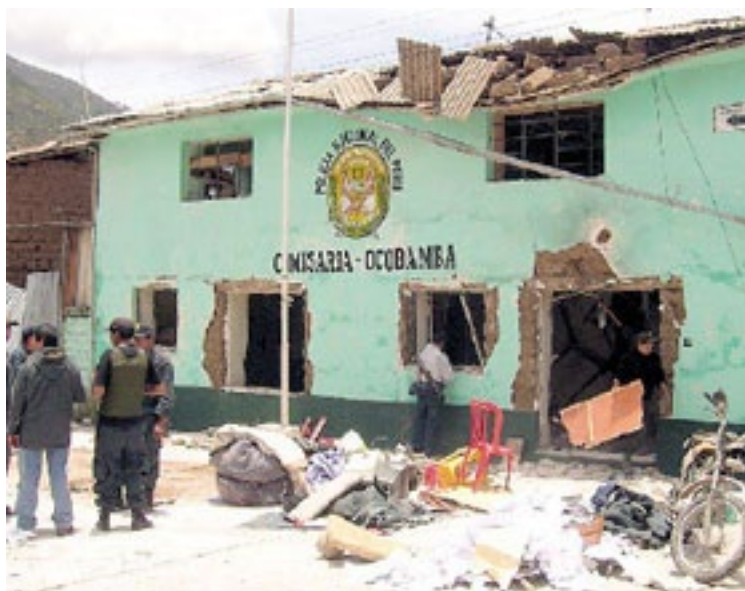
Después de la acción del Ejército Popular de Liberación en San José de Secce en Ayacucho, agosto de 2009

La tarea del Partido y del pueblo de construir la conquista del poder se mantuvo, constató en mayo de 2001 el CC y agregó: “Si vemos la situación del Partido y la creciente explosividad de las masas... construcción que se desenvuelve en medio de la guerra popular manteniendo al tope nuestras rojas e inmarcesibles banderas del comunismo en los comités populares, que hoy el imperialismo y las FF.AA. genocidas fascistas y sus compinches de la LOD revisionista y capitulacionista fracasaron en sus intentos de ahogar en sangre el Nuevo Poder en el Comité Regional Principal, así como otros Comités Regionales, de nada le sirvieron sus bombardeos indiscriminados, apoyos, incursiones, donaciones de alimentos, elecciones, asesores yanquis en el campo y en la ciudad, el soplón pagado e incentivado por la CIA* tanto para arrepentidos como a los mismos militares, todo