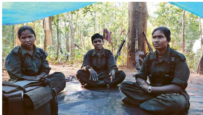
Combatientes maoístas en India

Entonces el imperialismo yanqui – como potencia hegemónica única- agradece a los países oprimidos para buscar controlarlos, para sacar ventaja y dominar a sus rivales (aquí se expresa la contradicción principal y la pugna ínter imperialista) en ejercicio de su hegemonía, pero como no está en condiciones de imponerse sólo en esta lucha, busca alianzas temporales según convenga,