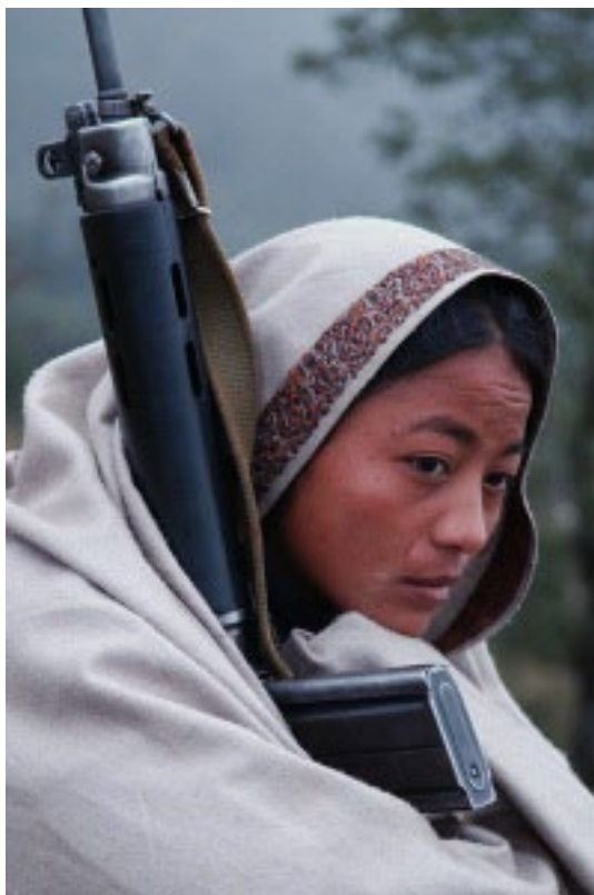
Combatiente del Ejército Popular de Liberación en Nepal

La cuestión es como la detención del Presidente Gonzalo fue usada por la reacción para tratar de destruir al Partido y detener la guerra popular para lo cual engendró a la LOD y cómo la reacción mundial buscó que ésta repercuta en el movimiento comunista internacional (MCI) y fomenta el nuevo revisionismo, es decir el maoísmo sin guerra popular como después se va a desbocar en Nepal. Esa es la responsabilidad del CoMRI y del PCR, independientemente de sus buenas intenciones, esto es, no haber tomado firme posición y permitir con ello la repercusión del plan del imperialismo en el MRI, en el abandono de la guerra popular por el camarada Prachanda y la dirección de ese Partido, hoy rebautizado como PCNM Unificado.