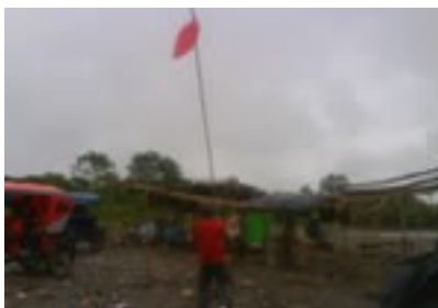
Embanderamiento en Huanuco, julio de 2009

Entre los campesinos del Valle del Huallaga unidades del EPL distribuyen miles de volantes en las cuales se convoca a las masas a combatir y resistir.