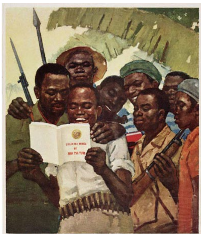
¡El Presidente Mao es el gran libertador!

El imperialismo no puede escapar a su ley de ser “tigre de papel”. A los apologetas del imperialismo yanqui y los oportunistas que fabulaban del “inmenso poderío bélico estadounidense”, que nadie podía poner en tela de juicio; hoy, no les queda más que reconocer la falsedad de esa fábula, así: “ como fue con las finanzas en esta década, igual sucedió con la guerra ” (“ As it was with finance in this decade, so it was with war ”) se lamenta el periódico de la burguesía imperialista yankee arriba citado, edición