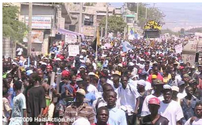
Protestas populares en Haití