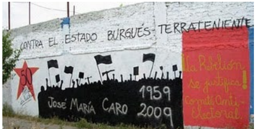
Pinta Mural en Chile, 2009

Entonces, esa política, en materia de recursos naturales de los gobiernos de los Estados terratenientes burocráticos al servicio del imperialismo, responde a la estrategia de los grandes monopolios imperialistas, especialmente de los grandes monopolios petroleros las IOC (siglas en inglés para compañías internacionales de petróleo), para sacar ventaja a sus competidores en la lucha intermonopólica y para maximizar la explotación de los países oprimidos, mientras promueven la demagogia del "beneficio" para los pueblos donde están ubicadas las fuentes de estos recursos naturales. Para muestra citamos lo escrito por uno de los representantes de un monopolio del imperialismo italiano, quién, a partir del hecho que el petróleo pertenece a los países productores (formalmente), dice: que "para jugar un rol en el futuro de la industria, nosotros debemos valorizarnos y eso a través de una estrategia corporativa sobre dos pilares: primero,