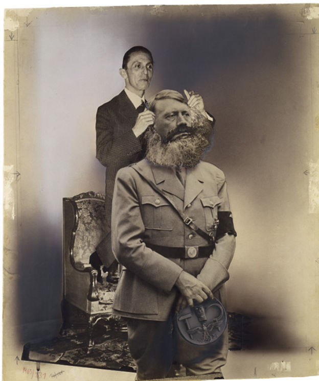
Goebbels disfrazando a Hitler de un “Marx” (John Heartfield)

través de organismos con representantes de diferentes estamentos, gremios, u otros grupos, los cuales con su “competencia de expertos” y en “acuerdo” toman decisiones políticas – en lugar de representantes elegidos en elecciones, como en el parlamentarismo burgués (ver que ambas formas sirven a mantener la dictadura burguesa). Ejemplos de tales organismos corporativos son los sindicatos fascistas en Alemania bajo Hitler e Italia bajo Mussolini, así como los “comités de autodefensa”, “comités de desarrollo”, COFOPRI, FONCODES, INADE etc. en Perú. La socialdemocracia (socialfascismo como dice Lenin) en países como Alemania o Suecia también desarrollan, especialmente desde el fin de la segunda