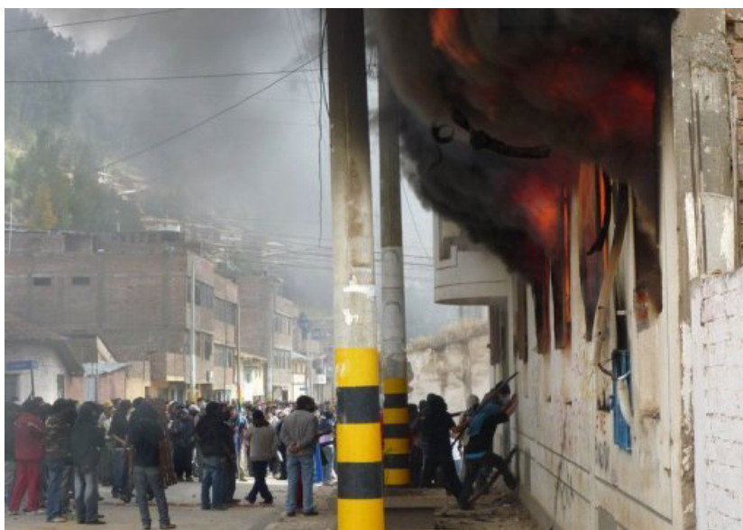
Protesta estudiantil en Huancavelica, Perú, 2011

Según datos oficiales el 39% de la población sigue viviendo en la pobreza. Todo esto ha creado una situación de continuos estallidos sociales, como el actual de las mineras o el de Bagua de hace ya dos años?, donde murieron decenas de campesinos pobres. Eso a pesar de las riquezas del país