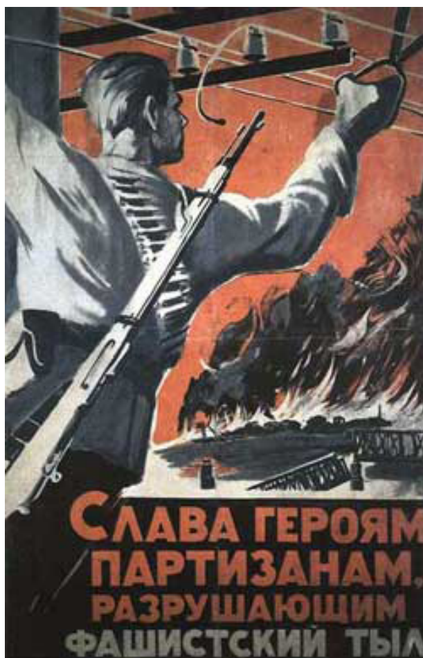
Afiche de la Unión Soviética llamando a llevar a cabo guerra de guerrillas y sabotaje contra los invasores fascistas

Irracionalismo – ya en los fines de los años 1800 y los comienzos de los años 1900, intelectuales burgueses desarrollaron las ideas que después devendrían en características de la ideología burguesa del imperialismo. La corriente "irracionalista", representado por Nietzsche, Shopenhauer y otros, rechaza las ideas de la Ilustración de comprensión científica y en su lugar glorifica la "intuición" y el "instinto". El enemigo principal de estos intelectuales, por supuesto, era el marxismo; mientras el marxismo analizó el mundo científicamente para transformarlo, la tarea de los pensadores burgueses fue impedir y negar este análisis con el objetivo de mantener el presente orden. Donde pensadores burgueses antes habían elevado la claridad y la objetividad, y hasta habían dado contribuciones