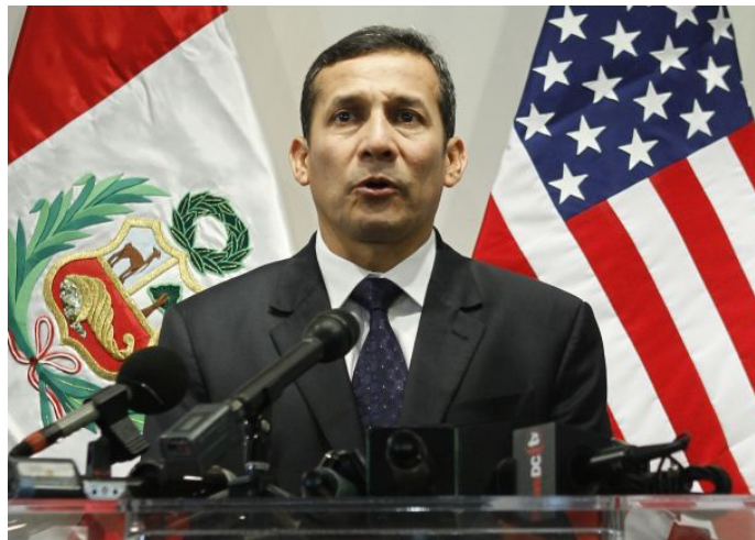
Ollanta Humala con sus dos banderas; la del viejo Estado reaccionario Peruano, y la del imperialismo yanqui

Susana Villarán declaró que “El liderazgo de la máxima autoridad del Estado es fundamental para que podamos, de verdad y por primera vez, hacer que el Conasec funcione. Creo que el Presidente fue muy claro en decirle a cada quién que es lo que tiene que hacer en este Consejo y confío en que pronto habrá resultados positivos” . Y un mayor poder del ejecutivo frente al poder legislativo y el poder judicial. Lo que se traduce en una mayor militarización del Estado reaccionario. Por ejemplo