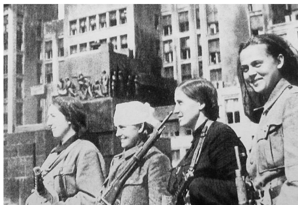
Partisanas comunistas en Minsk, 1944

El racismo , que en la versión burguesa de la historia ha devenido en el rasgo más característico del fascismo alemán, ha sido un componente recurrente en los movimientos fascistas. Pero no está limitado al fascismo y no es una parte necesaria de él, aunque se dio una forma más abierta y se aplicó más sistemáticamente por varios regímenes fascistas. En breve, es cuestión de la necesidad inevitable del imperialismo de conquistar nuevos territorios y como parte de eso esclavizar y matar a las poblaciones de estos territorios. Las ideas de la biología