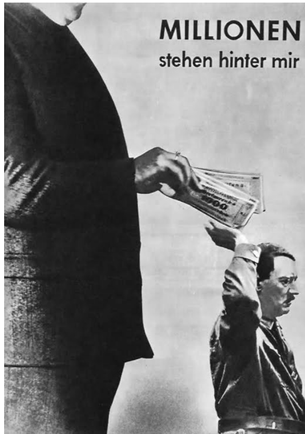
“Millones me respaldan” (John Heartfield)

Georgi Dimitrov no es suficiente. Él lo ha definido como “ la dictadura terrorista abierta de los elementos más reaccionarios, chovinistas e imperialistas del capital financiero ”. Una definición insuficiente porque no toma en cuenta el corporativismo como parte del fascismo, es decir la organización corporativa del Poder y la economía. El Presidente Gonzalo nos enseña: “ Cuestionamiento del parlamento es una posición básica del fascismo