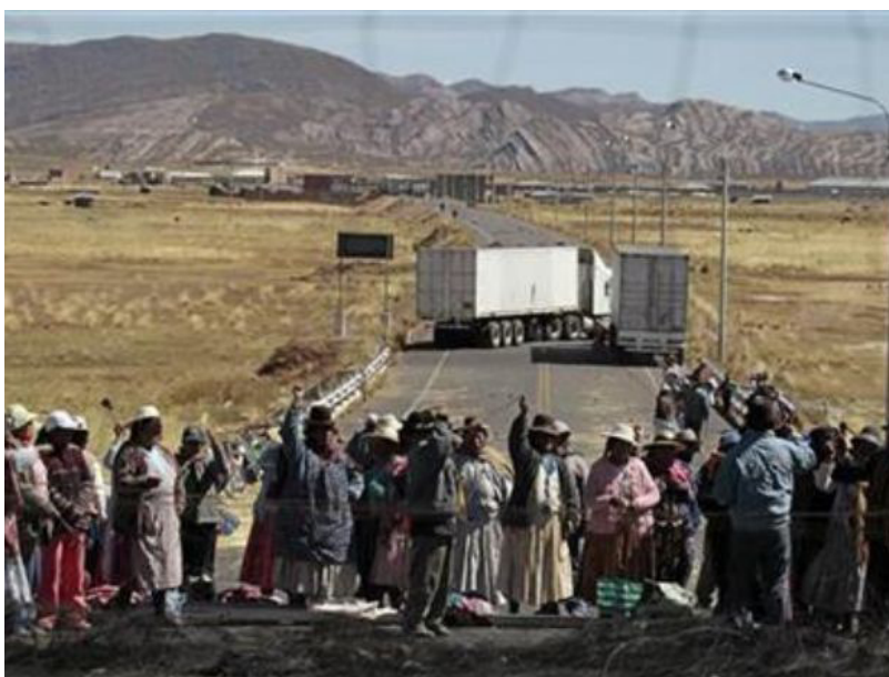
Protesta antiminera, Perú 2011

El propio Ollanta aclara las repercusiones de la ley: "Los procesos que se den de inversiones necesariamente van a tener que ser consultados con la población y el hecho