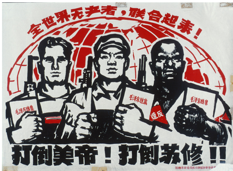
¡Abajo los imperialistas de Estados Unidos y los revisionistas rusos! (China 1967)

portante, sirve a los planes contrarrevolucionarios del imperialismo y la reacción. Es una característica de revisionistas, y en particular de los nuevos revisionistas de hoy, que evitan la lucha en toda forma posible. Son ellos que cuando las diferencias se presentan y las contradicciones se agudizan, prefieren simplemente irse, capitular totalmente o formar todo tipo de nuevos grupos y organizaciones. Los oportunistas van a seguir y apoyar