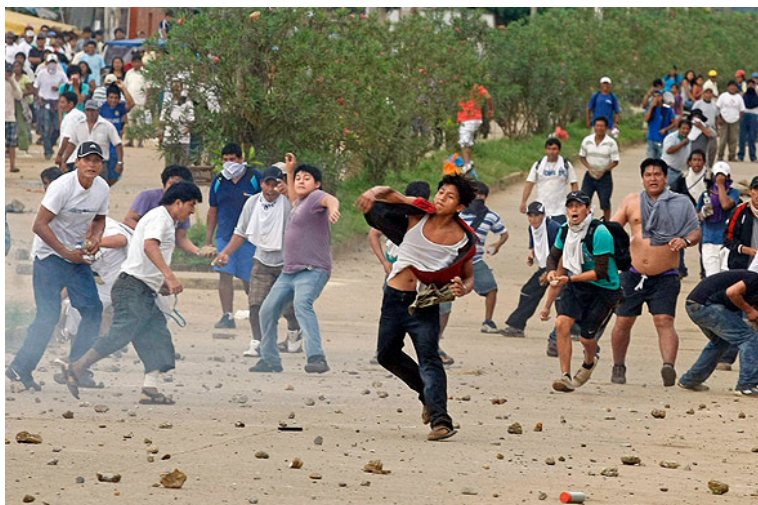
Protestas contra las mineras en Madre de Dios, 2012

“Queremos saludar al pueblo peruano que viene luchando y remediando al país, conquistando sus reivindicaciones en medio de heroicas jornadas; por enumerar algunas de ellas realizadas a lo largo y ancho del país en el mes de septiembre : La movilización de obreros de la minera Shougang -Hierro Perú, el reinicio de protestas de los maestros en Loreto, la huelga de mineros en Casapalca, los paros en Arequipa en contra de la minera Cerro Verde, los paros y movilizaciones en contra de la minera DoeRun en Junín, la movilización de los campesinos cocaleros en Ucayali, el bloqueo de carreteras en Piura, los bloqueos de carretera en Wari-Libertad en Ayacucho, la movilización de mineros de CEDIM Arequipa, la movilización de maestros en Apurímac, la realización del paro de transportistas con la población en Yunguyo, la movilización de aproximadamente 80,000 pobladores de Lambayeque por falta de agua, la movilización de campesinos de Chincheros y Andahuaylas que demandan la nulidad de las concesiones mineras, la huelga del Instituto Nacional de Enfermedades Neoplásticas-Norte en La Libertad, la movilización en Cajamarca de maestros con la población por la falta de agua, la movilización de pobladores de Tacna junto con las autoridades regionales contra el proyecto de la minera Southern, movilización contra las autoridades del Regional de Amazonas, la movilización de estudiantes universitarios por falta de docentes en la Universidad San Cristóbal de Huaman-