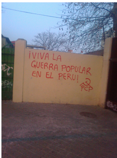
Pinta en Madrid, España, 2012

Para terminar, cabe señalar que la abstención superó los once millones. Que el rechazo al circo electoral se da sobre todo dentro de la clase obrera. Que las elecciones han traído un gobierno con mayoría absoluta y fuerte en el parlamento. Ya veremos cuánto tarda en entrar en crisis. Que sólo cabe una mayor agudización de la crisis dentro del marco de crisis global del imperialismo. Que la crisis política y social seguirá profundizándose. Que el revisionismo y el reformismo tratarán de seguir haciendo su papel de "policía bueno" para desviar a la clase obrera de su camino al socialismo y al comunismo. Cabe señalar otra vez como punto negativo y fundamental la falta de Partido Comunista marxista-leninista-maoísta, principalmente maoísta que inicie guerra popular para acabar con este podrido sistema de explotación y opresión y lleve adelante la revolución socialista mediante la guerra popular. Las condiciones están dadas.