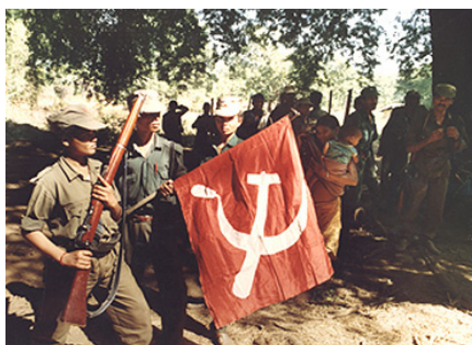
Combatientes del PCI(M)

Carta Abierta de 2009, citada anteriormente) rechazan todas las ilusiones democrático-burguesas, hay declaraciones más recientes que expresan una posición diferente, apelando a la supuesta buena voluntad democrática de las clases dominantes e insisten en conversaciones de paz: