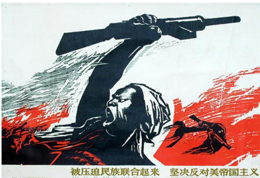
“Pueblos oprimidos, unirse para luchar resueltamente contra el imperialismo yanqui” (China 1964)

También la actual crisis ha puesto en evidencia el papel del “socialismo del siglo XXI”: parar la revolución. Los Humala, Correa, Evo Morales, Ortega, Chávez no han roto con el imperialismo, en todo caso han dejado entrar a otros imperialismos, principalmente al socialimperialismo chino, sin romper con el imperialismo yanqui. Las multi-