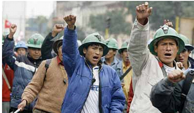
Movilización de obreros de la minera Shougang Hierro Perú

Centrando en extracción de minerales, en 2011 las ventas al exterior representaron algo más del 50% del total de las exportaciones, estimadas en 46.000 millones de dólares; agroindustria más de 3.000 millones de dólares; pesca, harina de pescado y otros productos derivados, mas de 2.500 millones de dólares (en 2010).