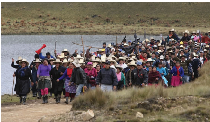
Protesta en Cajamarca contra los proyectos mineros, 2012