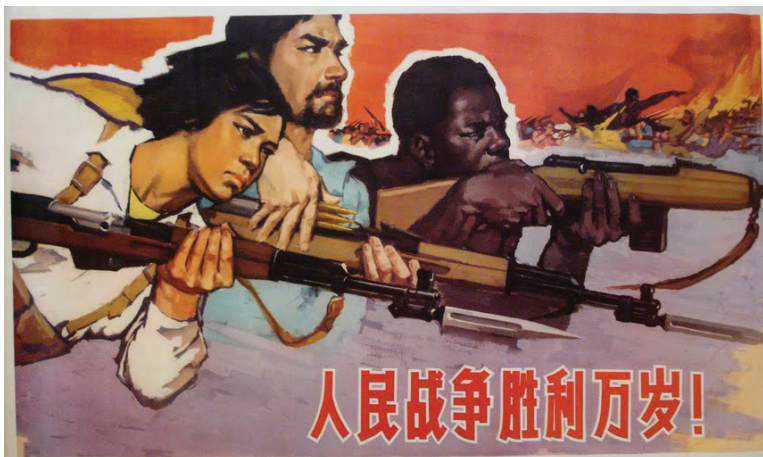
“¡Viva la victoria de la guerra popular!”

heroísmo de sus luchas, cada vez que ha habido una medida antipopular las masas se han expresado en contra con toda su rabia y violencia, éstas no han pasado de ser defensivas y de darse dentro del marco de la reforma, demostrando la falta de objetivos revolucionarios del anarcosindicalismo y su carácter burgués. El Estado burgués obra de otra forma, establece sus planes a años vista, se prepara para las batallas que van a llegar planificando a largo plazo y aplicando sus medidas inmediatas pensando en los resultados futuros. Sin su Partido Comunista las masas están condenadas a la derrota mientras que el Estado mayor burgués va aplicando sus propios planes. El proletariado también necesita su dirección centralizada, establecer sus propios planes y campañas, crear organizaciones superiores a las del enemigo, construir nuevo poder mientras destruye el viejo Estado, rebasar el “sindicalismo” y todo reformismo, el caso de Grecia es un ejemplo claro. El proletariado necesita de su Partido Comunista marxista-leninista-maoísta, principalmente maoísta para iniciar guerra popular, también en los países imperialistas.