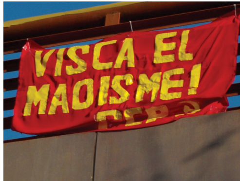
“¡Viva el maoísmo! PCP” Propaganda en Barcelona, España 2012.

En esta situación la clase obrera no ha dejado de luchar, son tiempos de movilizaciones tanto del obrero de la ciudad como del campo, de huelgas, manifestaciones, incluidas formas de lucha armada. Este año hemos podido ver cómo mineros del carbón se enfrentaban con su arsenal de armamento casero a fuerzas armadas del Estado, también en Madrid y Barcelona hemos visto como las masas se organizaban militarmente y se enfrentaban al Estado burgués en forma de una verdadera guerrilla urbana. Mientras las otras formas de lucha no han parado y siguen: luchas en los centros industriales, luchas de estudiantes y profesores, en la sanidad, en el transporte, etc.