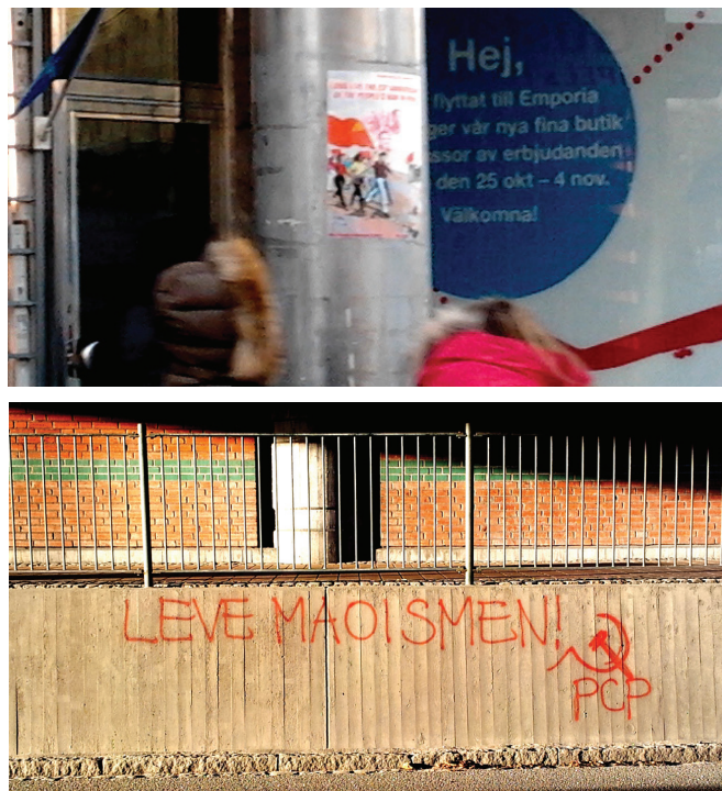
Malmö, Suecia, 2012: Afiche del MPP y la consigna “¡Viva el maoísmo! PCP”

conjunta y planificadamente bajo la dirección del imperialismo, principalmente yanqui. Es una línea militarista que sólo centra en acciones militares. Aniquilamiento del enemigo, confiscación de armas respetando el capitalismo