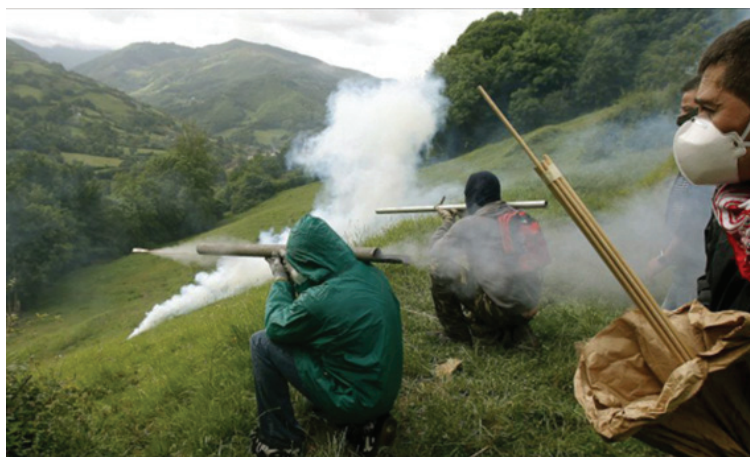
“Mineros del carbón se enfrentaban con su arsenal de armamento casero a fuerzas armadas del Estado”