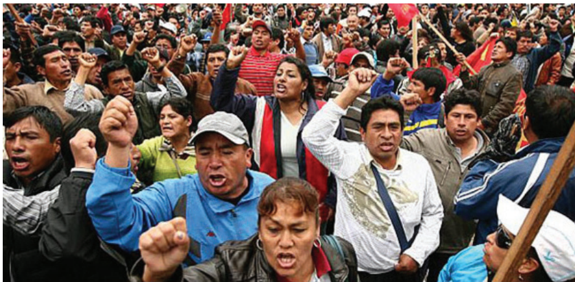
Protesta de profesores, Perú 2012

En el actual gobierno reaccionario se han incrementado las tropas yanquis. A su vez, existe una movilización de efectivos militares de países limítrofes. Brasil desplazará 7.500 soldados a las fronteras de Perú y Bolivia con el pretexto de “combatir el narcotráfico”. Según el Ministro de Defensa de Brasil, Celso Andrin, con el apoyo de cazabombarderos y helicópteros llevarán también “ayuda social” y medicamentos.