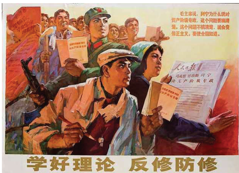
“Combatir y prevenir la revisión de los principios marxistas” Cartel de la Gran Revolución Cultural Proletaria en China.

La LOI se opone a la militarización y a la construcción concéntrica del Partido pues construye en función de la negociación y no en función de la demolición del viejo Estado donde el Partido dirige omnimodamente el ejército y el frente apuntando a la toma del poder. “La construcción concéntrica de los tres instrumentos es la plasmación orgánica de la militarización del Partido y en síntesis se resume en lo que el Presidente Gonzalo enseña: El Partido es el eje de todo, dirige omnimodamente los tres instrumentos, su propia construcción, absolutamente el ejército y al nuevo Estado como dictadura conjunta apunta a la dictadura del proletariado” (Línea de construcción. PCP). Vemos pues por qué la LOI ataca al pensamiento gonzalo pues es éste el que garantiza el rumbo de la revolución, garantiza la dirección proletaria de la guerra popular con ideología proletaria, aparatos propios y formas proletarias de organización apuntando hacia la dictadura del proletariado.