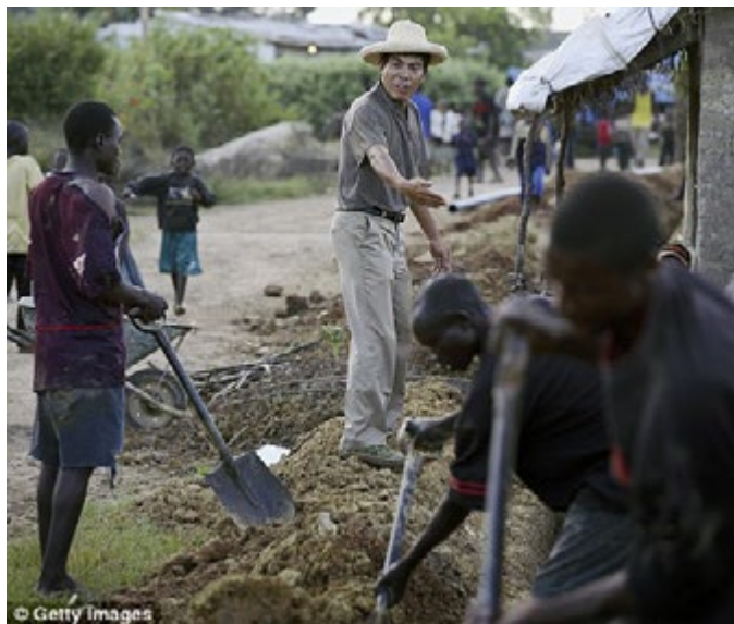
Un capataz de una empresa china supervisando a obreros en Zambia, 2007

El fascismo bolivariano trata de explicarlo buscando culpables del desabastecimiento de productos básicos en Venezuela en conspiraciones. Acorde a la cada vez mayor corporativización y fascistización del estado venezolano, el “médium” Maduro ha acusado de los males de la economía a los empresarios “burgueses”. Ha “descubierto”, como todas las “terceras vías”, que los burgueses no son una clase social que detenta la propiedad de los medios de producción y el poder del estado en Venezuela, sino un “insulto”. Ha “descubierto” que los empresarios no son burgueses, tal y como pronto descubrirá a los malos proletarios, a los comunistas, a los que habrá que exterminar. En la