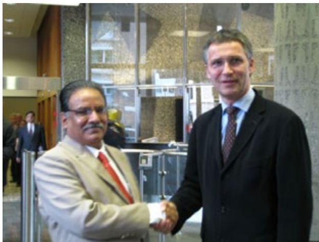
Prachanda con el primer ministro de Noruega

Swiss Federal Department of Foreign Affairs (Suiza) y la BMZ.