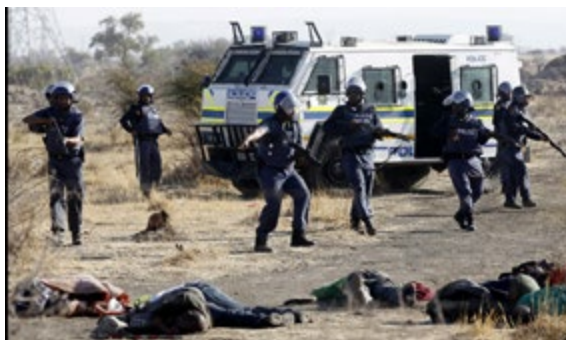
La masacre de Marikana