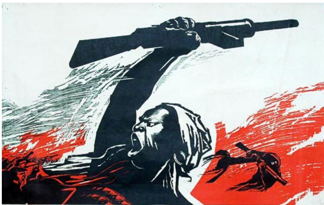
¡Pueblos oprimidos, unirse para combatir resueltamente al imperialismo yanqui!, China 1964

Es necesario desarrollar lucha de dos líneas, de forma franca y honesta, para aplastar y barrer todo este nuevo revisionismo, todas las convergencias con Avakian. Es necesario combatir el plan mundial del imperialismo, la reacción y el revisionismo de convertir toda lucha popular, principalmente las guerras populares y luchas armadas dirigidas por Partidos Comunistas, en luchas vendidas, ajustadas a los intereses del imperialismo. Luchas no por aplastar y barrer los estados imperialistas, no por instalar la Nueva Democracia y continuar ininterrumpidamente con la revolución socialista y las revoluciones culturales proletarias hasta el comunismo, sino por la dictadura burguesa bajo el manto de “socialismo del siglo XXI” o de democracia burguesa. Este es el plan de “acuerdos de paz”, de capitulación y amnistía, de cretinismo parlamentario, que ahora difunden con la ayuda del nuevo revisionismo, es decir, un revisionismo para cumplir el papel de instalar “partidos maoístas” de membrete.