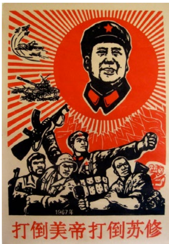
“Derrotar el imperialismo americano, derrotar el revisionismo soviético”, China 1967

al menos 15 detenidos y un número no determinado de heridos”. El 26 de septiembre se convocaba una jornada de huelga nacional, la prensa burguesa informaba que en Ancash, Ayacucho, Cusco, Iquitos y la provincia limeña de Cañete registraron enfrentamientos entre manifestantes y policías. Vemos cómo van cumpliéndose los planes del PCP y lo justo de centrar en el trabajo de masas y cómo la movilización por lo reivindicativo va confluyendo con la guerra popular. En Ecuador, el CR-PCE ha llevado una amplia campaña de apoyo a la Conferencia Internacional celebrada en Madrid. En Chile, el Estado chileno está aplicando la ley antiterrorista de Pinochet contra el pueblo mapuche, también hay que destacar la movilización estudiantil y su radicalidad. En Brasil las masas han estallado contra el Estado brasileño. En Sudáfrica, en septiembre, se pusieron en huelga alrededor de 2.000 trabajadores mineros de la American Platinum. La clase obrera de Sudáfrica volvió a demostrar una vez más el rechazo a un Estado que condena al pueblo a la más absoluta de las miserias. El 7 de agosto un comando de élite israelí entró en territorio libanés siendo atacado y derrotado, dando las masas armadas otro golpe al sionismo.