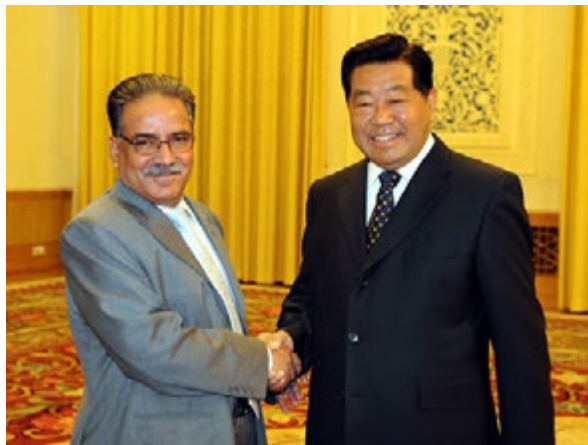
Prachanda con el representante del revisionismo chino, Ai Ping

ses, promueven la participación de ciertos actores y excluyen a otros. Asimismo, apoyan a mujeres y a hombres desfavorecidos para que éstos puedan expresar y exigir sus derechos (empoderamiento). Consecuentemente, intervienen en las estructuras de poder existentes.” Además “Los programas de la COSUDE sensibles a los conflictos tienen como objetivo prevenir o ayudar a superar la violencia, al igual que apoyar modos constructivos de tratar los diferendos”. Tratar las diferencias de forma constructiva, no lo dice el nuevo revisionismo, es el imperialismo a través de sus aparatos el que se está expresando de la misma forma. Conciliación de clases. “Un enfoque sensible a los conflictos significa, pues, fomentar el comportamiento constructivo y desligarse de comportamientos destructivos. Probablemente, quien mejor ha explicado este enfoque ha sido Mahatma Gandhi.”