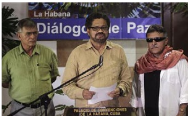
Los negociadores de las FARC en Cuba, agosto de 2013

El Estado Suizo es otro imperialismo que está participando de forma activa en los "procesos de paz y reconciliación" como forma de intervenir en los países donde actúa como mediador-impulsor de estos procesos. A su vez