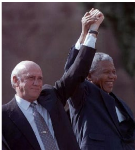
Mandela con el genocida De Klerk

El 16 de agosto de 2012, en la mina Marinaka 40 mine-