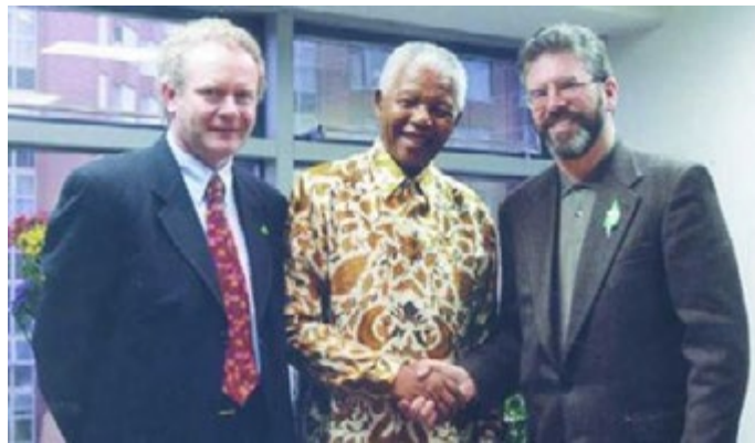
El traidor Mandela con los traidores de Irlanda, Martin McGuinness y Gerry Adams

En la Conferencia Internacional para promover la resolución del conflicto en el País Vasco participaron entre otros Gerry Adams, el "Mandela irlandés", y clave en los acuerdos de Paz de Belfast en 1998. La Conferencia está promovida por Berghof Foundation, Conciliation Resources, The Desmond and Leah Tutu Legacy Foundation, el GIC, Lokarri con el objetivo de promover un proceso de paz "inclusivo".