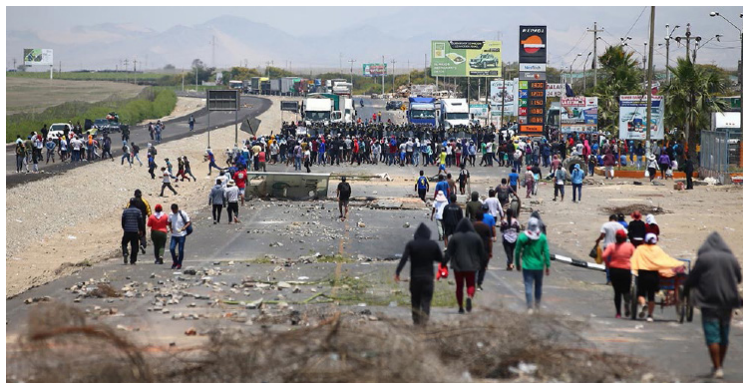
Cuzco, Perú, 2022

También se ha analizado la penetración económica, cultural y política de la superpotencia china en el Perú dentro de la contienda y el reparto del mundo que se está dando entre las superpotencias y potencias imperialistas.