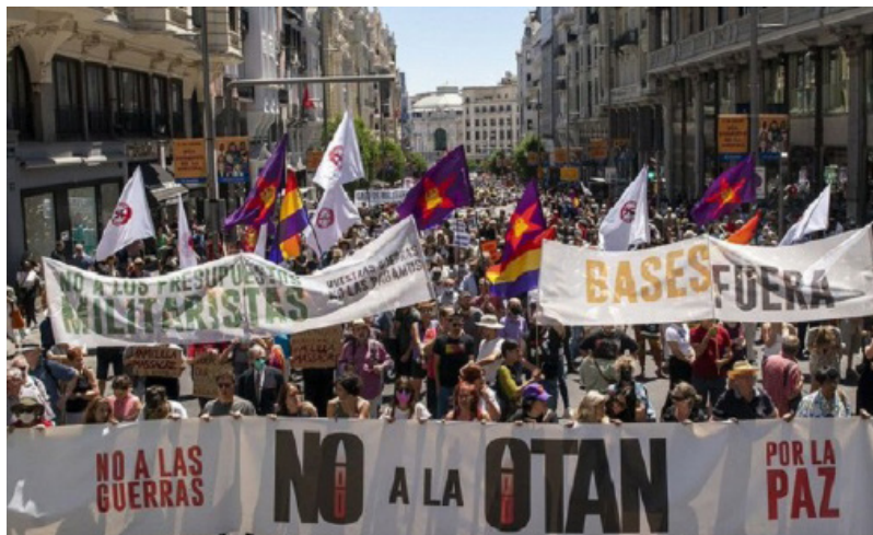
Madrid, España, 2022

tienden a ser antiimperialistas, estos revisionistas tienen que esconder su política pro-imperialista bajo la propaganda pacifista: por ejemplo, no están en contra de la OTAN y sus guerras de rapiña, pero al presentarse ante las masas las “critican” o se oponen a algunos de los aspectos de dichas guerras. Y cuando – como vemos ahora – crece la oposición de