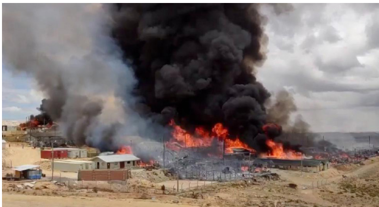
Apumayo, Perú, Octubre de 2021

que la prensa burguesa considera una vuelta a los años 80. La mina de cobre Las Bambas ha estado más de 50 días paralizada por el bloqueo de las masas campesinas. A finales de mayo las minas de Las Bambas de la china MMG Ltd fue incendiado por las masas. En esas mismas fechas el proyecto Los Chancas de la mexicana Southern Copper fue asaltado por 300 campesinos perfectamente