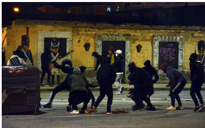
El barrio obrero Gamonal, Burgos, España 2020

A mediados de 2021, quedaba claro que el Poder Ejecutivo, durante meses, había gobernado de forma ilegal. El Tribunal Constitucional declaró en julio de 2021 ilegal el primer estado de alarma votado por todos los partidos del parlamento, incluida la extrema derecha de VOX. Declarando como inconstitucional el confinamiento durante el estado de alarma, es decir, la limitación de la circulación de personas y vehículos y la capacidad del Ministerio de Sanidad para modificar y ampliar las medidas de contención en la actividad comercial.