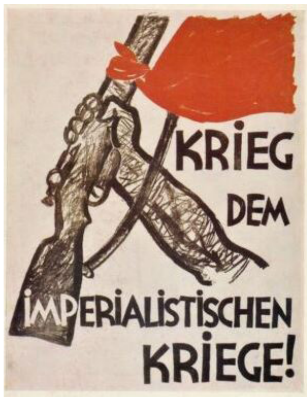
Cartel alemán: "¡Guerra contra la guerra imperialista!"