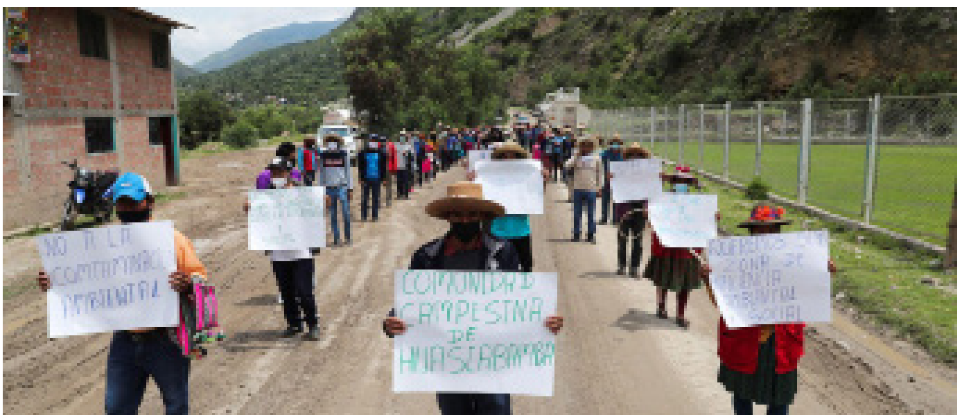
Huascabamba, Perú, 2022

Lo que se evidencia en el Perú es el avance de la guerra popular dirigida omnímodamente por el PCP y que se viene cumpliendo lo que el CC del PCP anunciara hace una década: “No hay leyes ni represión que detenga a las masas, ellas están con el Partido, con los maoístas, compartiendo tareas. La clase y el pueblo en sus jornadas de lucha demandan que el EPL enfrente a las FFPP y FFAA genocidas.”