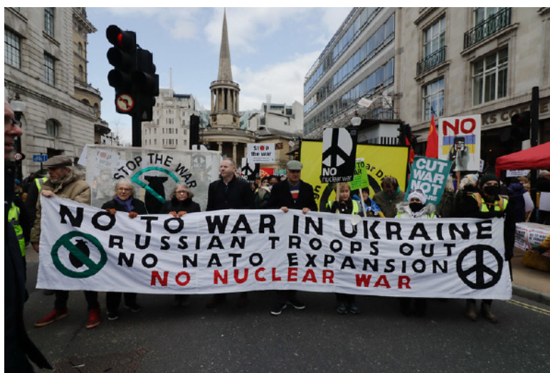
Marcha contra la guerra imperialista, Londres, Inglaterra 2021

contrado una inesperada resistencia popular: ver la fuerte oposición en Rusia contra la invasión de Ucrania, y en EE.UU. una nueva generación de activistas antiimperialistas revolucionarios y progresistas. Incluso en los países nórdicos, a pesar del tan arraigado socialchovinismo y servilismo frente a la superpotencia yanqui, la campaña actual para incorporarse en la OTAN está encontrando cada vez más resistencia popular. En Atenas, Grecia, miles de personas se movilizaron el 4 de Marzo en una contundente demostración contra la invasión rusa y contra la OTAN,