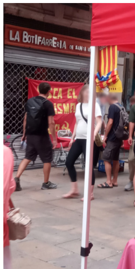
Barcelona, Catalunya, 2022