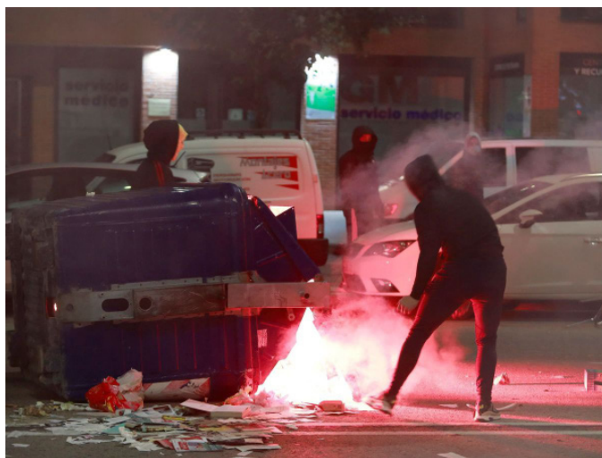
El Barrio obrero Gamonal, Burgos, España 2020

Las modificaciones del “gobierno progresista” no cambian nada de esto. La ley aprobada por Rajoy ya era una ley eminentemente presidencialista que ponía la gestión del Estado bajo un mando único en caso de “crisis”: el Presidente del Gobierno. La actual modificación, aprovechando el COVID-19, no ha hecho otra cosa que ampliar los escenarios de “emergencia” a casi cualquier situación y por tanto permite la declaración de “emergencia” por el Presidente del Gobierno en cualquier momento.