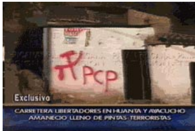
Pinta en la carretera Los Libertadores en Ayacucho: hoz y martillo, “PCP”.

En uno de los reportajes de Correo , se ve como la guerra popular avanza en el norte del país - hasta erróneamente tratan de presentarla como la zona donde hay más actividad del PCP. El diario nombra varios distritos de los departamentos La Libertad y Ancash como “zonas rojas”; reconoce que el Partido realiza un intenso trabajo político en asentamientos humanos de Ancash; habla del trabajo partidario en la Universidad Nacional del Santa y dice que se ha “copado” el sindicato de los maestros y hasta el “Poder