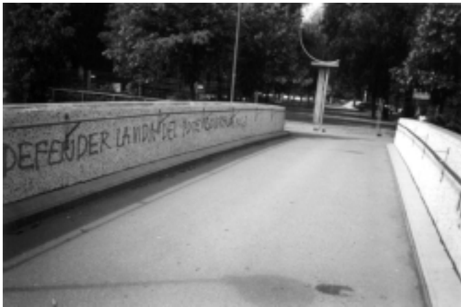
Pinta en suecia, 2003

rotados, más aún, si como señalara el Presidente Mao, después de la segunda guerra mundial, en el mundo, la masa se ha puesto de pié y nunca más podrán aherrojarla, los pueblos quieren la revolución, las naciones su emancipación y los países su independencia y todas las luchas que estos libren forman parte del poderoso movimiento de liberación