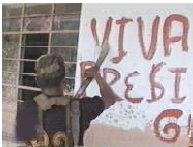
Pinta en el sur de Ayacucho: "Viva el Presidente Gonzalo!" (detalle)

en el consenso, la armonía y la tolerancia entre unos y otros. ". Pero la elección de la nueva mesa directiva con el acólito (Pease) como presidente del Parlamento ha mostrado las dificultades que tienen para el gobierno parlamentario, ha sido una elección en medio de escándalos y chantajes; con votos comprados a precio muy alto y compromisos inmundos al estilo de los que acostumbran Fernando Olivera y su FIM; con una mayoría artificial y hecha de remiendos; y ha avivado la pugna de los apristas, de los de Unidad Nacional, etc. Todos piensan en reemplazar a Toledo, por tanto es un todo contra todos, dentro de los mismos "partidos" comenzando por el de Toledo (PP). Si miden sus pasos es por el temor a nuestra guerra popular. Además, tienen cabeza de curules, y ante el