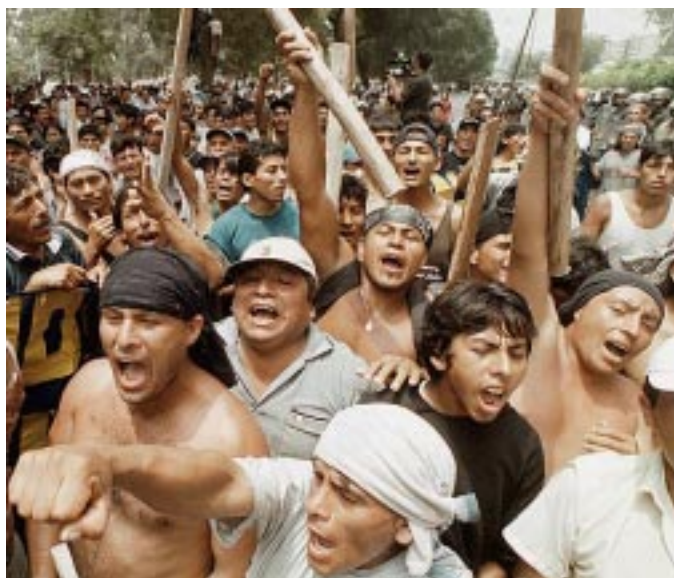
Manifestación de los obreros de Construcción Civil, enero de 2003

En todo ligado a la cuestión del narcotráfico, el imperialismo yanqui y la reacción peruana aplican una doble política. Los