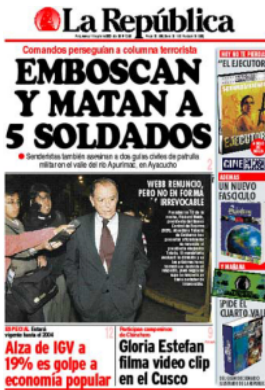
La República 20030711