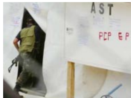
Detalle del campamento de Techint en Toccate después de la acción, pinta: "PCP", "GP".