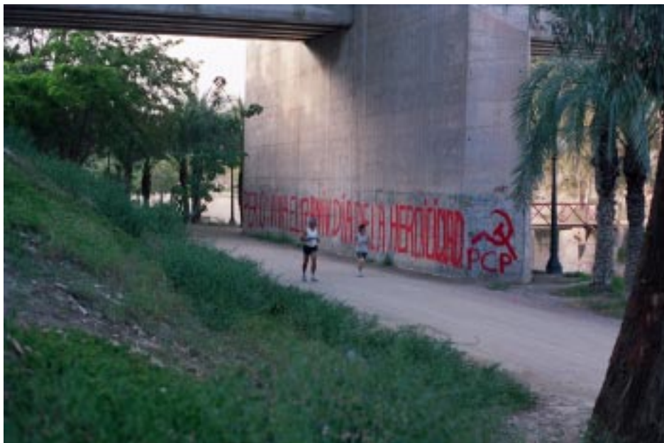
Pinta en España: "Perú: ¡Viva el 17 aniv. Día de la Heroicidad!"

entrevista, que "se han encontrado pintas (del Partido, nota de SR) desde Huancabamba en el norte ( en Piura- nota de SR) hasta la zona sur de Apurímac" ( La República, Lima 06 de julio de 2003). Como comprobación política del fracaso del enemigo en su "guerra de baja intensidad", bajo mando yanqui, contra nuestra guerra popular está la necesidad que