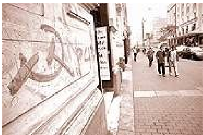
Pinta en Lima: hoz y martillo, "PCP".

Las medidas concretas siguen muy pronto, con la aprobación